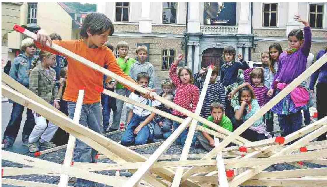
»PA SE IGRAJMO MIKADO!«