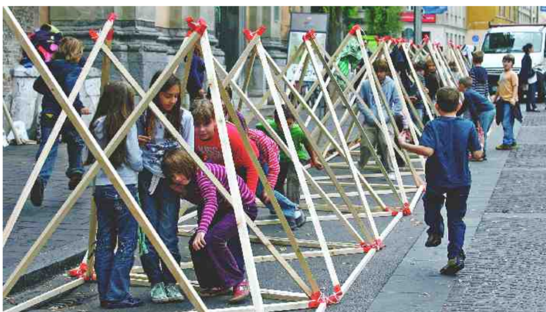
UREJEN »DREVORED« PIRAMID