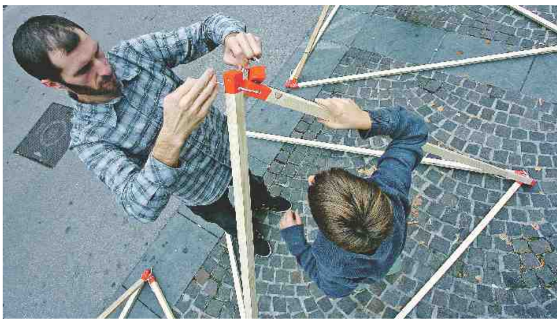
ŠEST PALIC JE MOGOČE SESTAVITI V TRONO TRIDIMENZIONALNO STRUKTURO