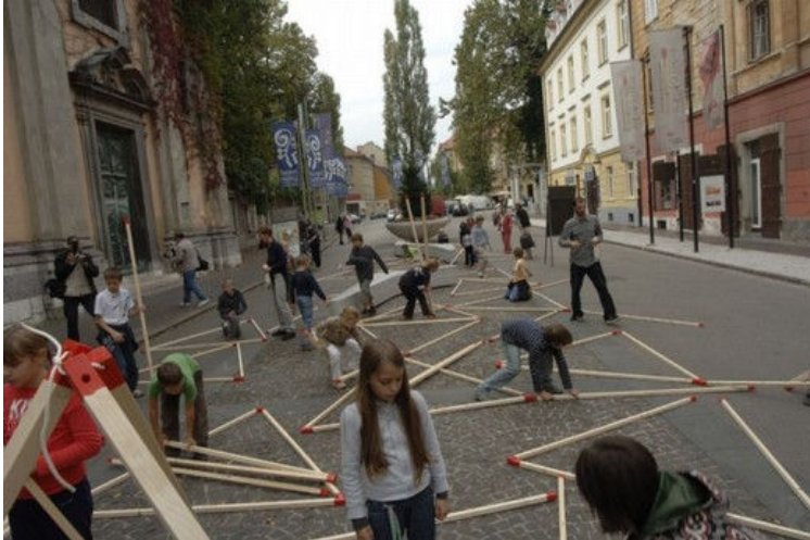
Naenkrat je na trgu zrastle petindvajset piramid.

izobraževanja o arhitekturi. Zelo pozitiven odziv pa je pokazalo tudi Ministrstvo za okolje in prostor , ki je finančno podprlo naš dogodek na dan Habitata.