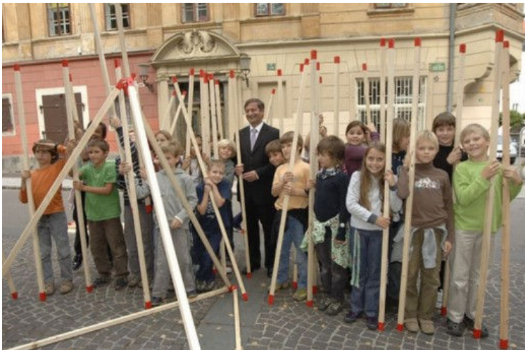
Dogodka se je udeležil tudi minister za okolje in prostor Karel Erjavec.

Ja, po prvem delu igre je arhitekt razložil otrokom, da so do takrat delali dvodimenzionalno. V prostoru, oziroma v arhitekturi, pa obstaja tridimenzionalnost. Povedal jim je, da bodo igro nadaljevali z gradnjo piramid. Mimogrede je povedal še kratko zgodovino piramid - da so jih gradili že Egipčani, da so spodaj široke in zgoraj ozke in da lahko z današnjo tehnologijo gradijo piramide, obrnjene s konico navzdol. Vsak otrok je nato dobil šest palic in štiri vrvice. Po tri je zložil v trikotnik na tleh. S pomočjo vzgojiteljev jih je moral zvezati s pravilnimi vozli, da se vrvice niso razvezale. Ostale tri pa je bilo potrebno privezati zraven tako, da je nastala piramida. Otroci so se v njih skrivali, jih premikali. Vsak je tako ustvaril svojo hiško, svoj brito, svoje zavetje... Lahko so jih premikali in se z njimi igrali, vendar so ugotovili, da morajo paziti, ker so bile poleg sosednje piramide in je bilo gibanje zato omejeno. Na koncu so jih zložili še v urejeno kolono, pri čemer je bilo zopet pomembno opazovanje matematičnih in prostorskih zakonitosti, da je nastala urejena vrsta.