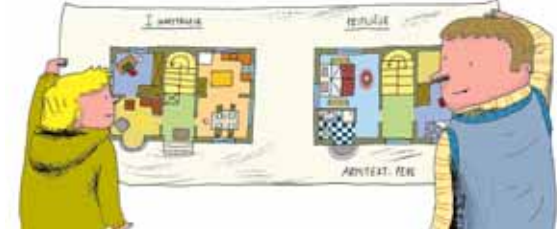
MOJSTRI POSTAVJO HIŠO PO NAČRTU, KI GA NARIŠE ARHITEKT