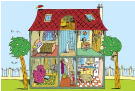
»POMISLI MALO, ALI JE TALE STENA, KI LOČI SPALNICO OD DNEVNE SOBE, KAJ DRUGAČNA OD STENE, KI LOČI NOTRANJOST IN ZUNANJOST HIŠE«